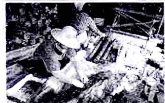
การนำเชื้อเห็ดใส่รูแล้วบิดปากรู