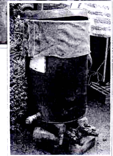
ถังนึ่งฆ่าเชื้อ

จึงนำขึ้นมา เอาค้อนทุบตรงหัวไม้หรือจับกระแทกเพื่อให้เนื้อเยื่อของไม้ขยายตัวและอากาศเข้าไปเป็นการกระตุ้นให้ออกดอกเร็วขึ้น ต่อมานำเข้าโรงเรือนเปิดดอก วางพียงราวให้ท่อนไม้เรียงประมาณ 70 องศา รดน้ำวันละ 2 ครั้ง เห็ดจะทยอยออกดอกเรื่อยๆ ซึ่งท่อนไม้เมเปิล 1 ท่อน สามารถเก็บเห็ดได้นาน 1-2 ปี หรือจนกว่าท่อนไม้จะผุ ส่วนปริมาณการเก็บต่อครั้งต่อท่อน มีผลผลิตประมาณ 4-6 กิโลกรัม