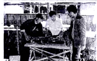
การเจาะรูที่ท่อนไม้เมเปิล