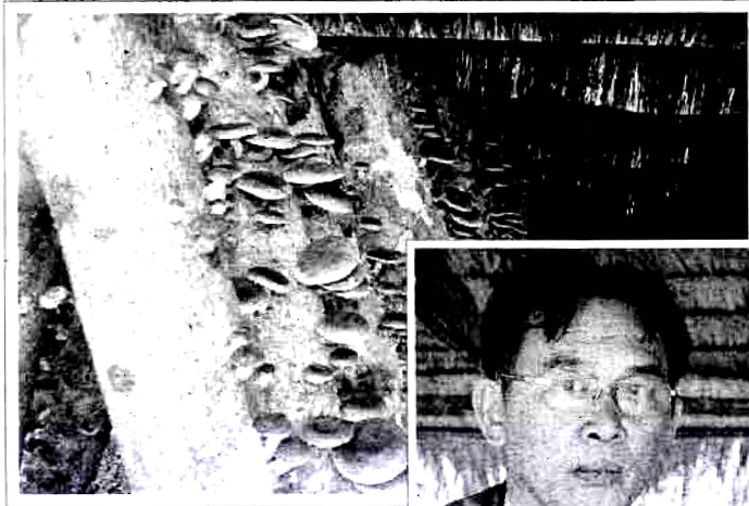
เห็ดหอมบนท่อนไม้เมเปิล

สำหรับอุปกรณ์ที่ใช้ในการเพาะเห็ดหอมกับท่อนไม้เมเปิล มีท่อนไม้เมเปิล เห็ดหอมในถุงเชื้อ ส่วน ปูนหรือขี้ผึ้งหลอมหรือเปลือกไม้เมเปิล ส่วนวิธีการทำ เริ่มจากการเตรียมเชื้อเห็ดหอม โดยเป็นเชื้อที่มีเส้นใยเค็ดเจริญเต็มขวดหรือเต็มถุงแล้ว นำท่อนไม้เมเปิลที่ได้จากการตัดสางมาใหม่ๆ หรือตัดทิ้งไว้ให้น้ำ