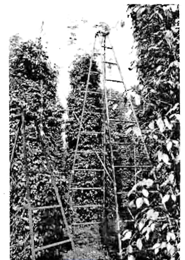
บ้านเค็บพริกไทย

“เกษตรกรพริกไทยผู้ยิ่งใหญ่ของโลก” (World's Greatest Pepper Farmer) จากชมรมพริกไทยนานาชาติ เมื่อวันที่ 18 เมษายน 2556 จึงได้รู้ว่าชาวต่างชาติที่มาพบ