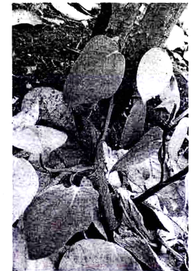
กล้าพริกไทย ที่เพาะจากไหล

ก่อนที่ ตราณ ฮู แห่งท์ จะมาเป็นตำนานแห่งพริกไทยของเวียดนาม และครุภูมิปัญญาท้องถิ่น เขามาจากครอบครัวที่ยากจน ใน