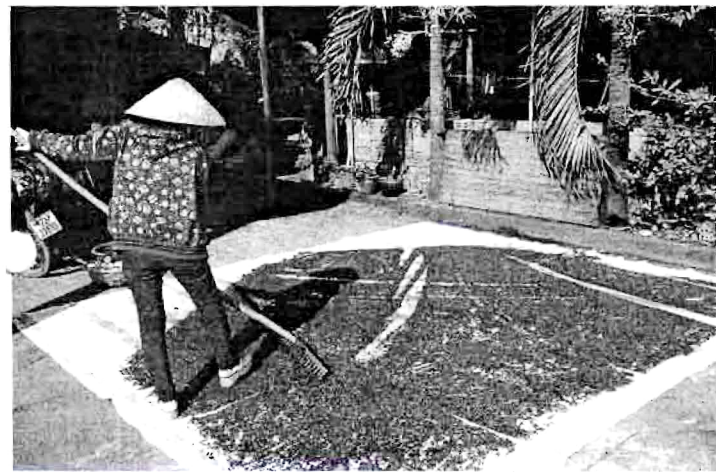
ตากพริกไทย

จนสามารถซื้อที่ดินเป็นของตนเองได้ 4,000 ตารางเมตร (2 ไร่ครึ่ง) เพื่อปลูกพริกไทยและข้าวโพด ภายในบ้านหลังใหม่ที่โอ้อ่าพริกพร้อมไปด้วยเครื่องตกแต่งบ้านที่หรูหราแห่งที่ เล่าว่า