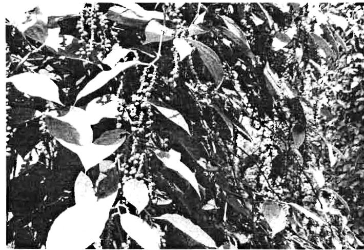
แปลงชำโหล

การปลูกพริกไทยเกือบทั้งหมดเขาใช้ต้น นุ่นทำค้ำให้พริกไทย จะมีต้นไม้อื่นๆอื่น เช่น มะรุม กระถิน ทองหลาง และต้นแพกา หรือลิ้นฟ้าบ้างเล็กน้อย ซึ่งทั้งหมดเป็นพืช ตระกูลถั่ว และเจริญเติบโตเร็ว การที่ใช้ต้น นุ่นเป็นส่วนมาก เพราะเกษตรกรเขาบอกว่า ต้นนุ่นจะแย่งปุ๋ยจากพริกไทยน้อยกว่าต้นพืช